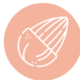
FRUTOS DE CASCA RIJA NUTS