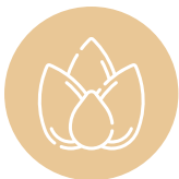
SEMENTES DE SÉSAMO SESAME SEEDS