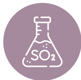
SULFITOS E DIÓXIDO DE ENXOFRE SULPHITES AND SULPHUR DIOXIDE