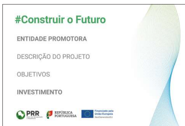
Modelo 2 – Formato 100cm (L) x 150cm (A)

NOTA: Este layout é de maio de 2022. Caso tenha cartazes prévios a esta data, os mesmos apresentam um layout antigo. Dado terem sido produzidos antes da introdução da nova linha gráfica, consideramos que podem continuar a ser usados.