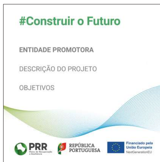
Modelo 3 – Formato 40cm (L) x 40cm (A)

NOTA: Este layout é de maio de 2022. Caso tenha cartazes prévios a esta data, os mesmos apresentam um layout antigo. Dado terem sido produzidos antes da introdução da nova linha gráfica, consideramos que podem continuar a ser usados.